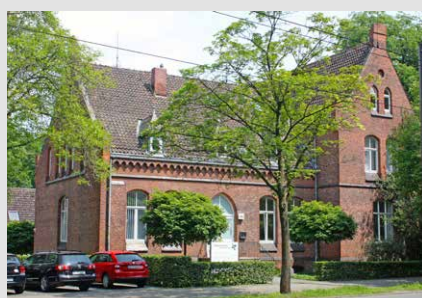
Diakoniewerk Kirchröder Turm