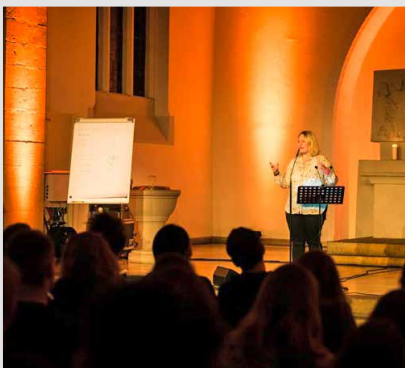
Preacher & Poetry Slam 2019

Am 8. Mai findet ein ganz besonderer Abend statt. Alles dreht sich um das Thema „Frieden“. Wir feiern 75 Jahre Frieden in Deutschland in dem Wissen, dass viele Menschen auf der Welt in Krieg und Unfrieden leben. Dies ist noch einmal zu fragen: Wo fängt Frieden an? Was können wir für den Frieden tun? Und was sagt Gott eigentlich dazu? Mit selbstgeschriebenen Texten treten Poetry-SlammerInnen und Kirchenprofis zur modernen Dichterschlacht an und das Publikum entscheidet über den Sieger des Abends. Veranstaltet wird der Abend von dem Netzwerk UNITED (Jugendkirche Hannover,